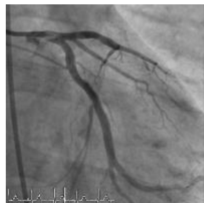
Figuur 3: Beelden tijdens de coronarografie