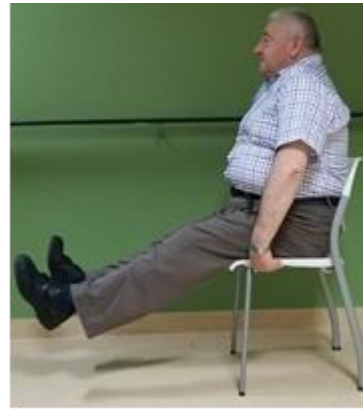
Beide benen strekken