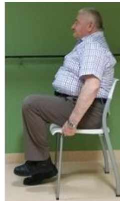
Hef de knieën afwisselend op