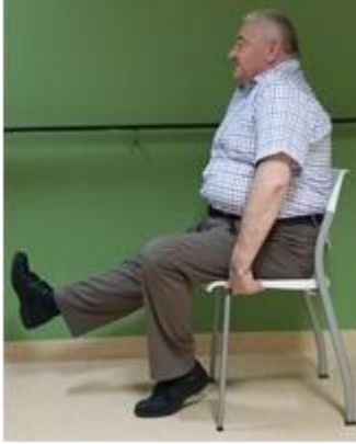
Afwisselend rechterbeen en linkerbeen strekken