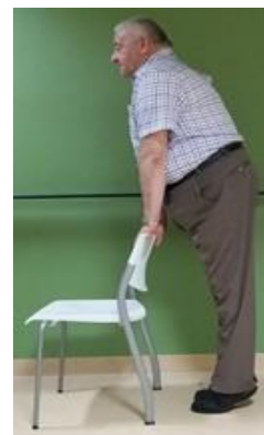
Ga op de tenen staan en tel tot 10