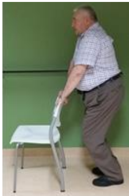
Buig door de knieën

Hieronder volgen enkele oefeningen die u thuis kunt uitvoeren. Indien zelfstandig oefenen moeilijk is, kunt u beroep doen op een kinesitherapeut op voorschrift van de behandelende arts.