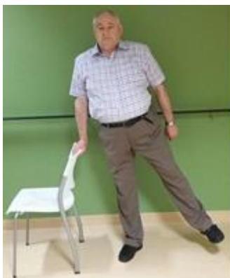
Hef het been zijwaarts op