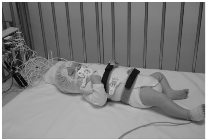
Alle elektroden en sensoren werden aangebracht, de wiegendoodscreening kan van start gaan.