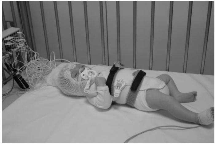
Alle elektroden en sensoren werden aangebracht, de wiegendoodscreening kan van start gaan.