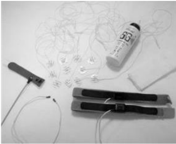
Materiaal nodig voor uitvoeren van het onderzoek