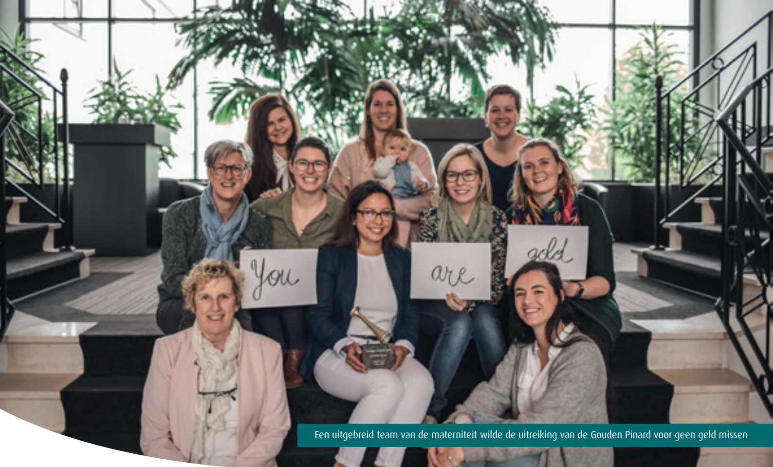
Een uitgebreid team van de materniteit wilde de uitreiking van de Gouden Pinard voor geen geld missen