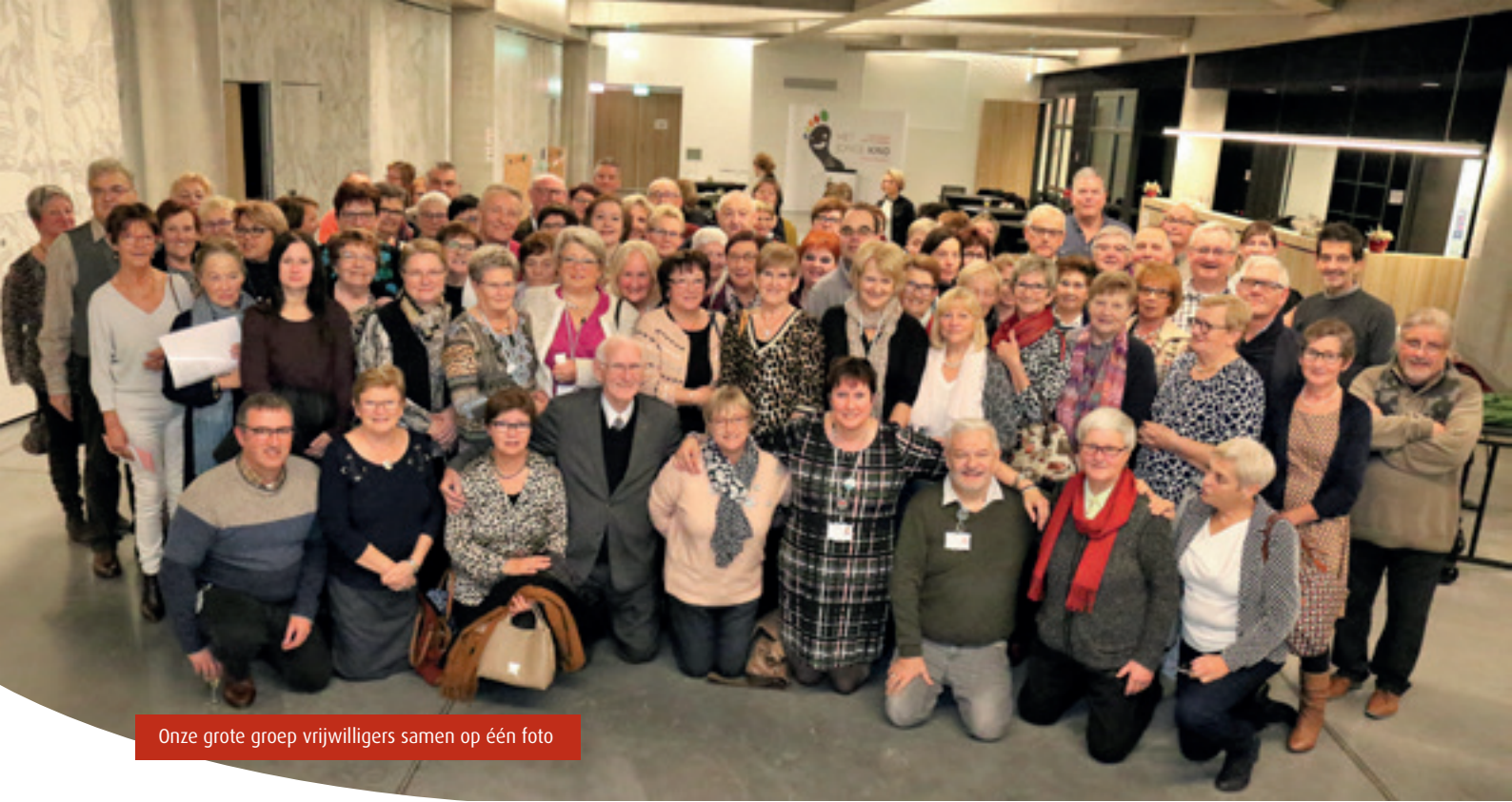
Onze grote groep vrijwilligers samen op één foto