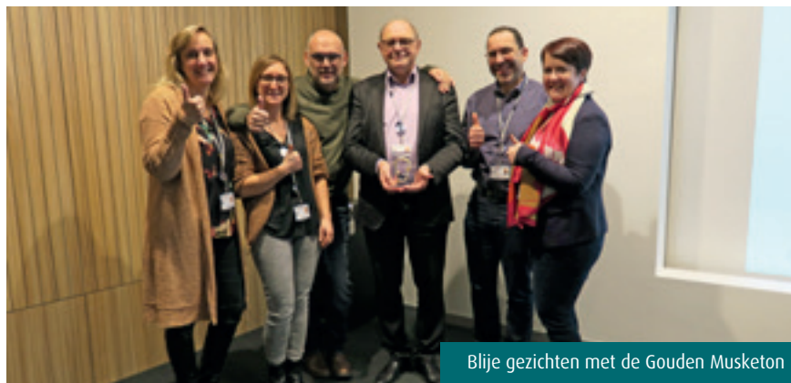
Blijde gezichten met de Gouden Musketon

ZorgAnders, mediabedrijf in de zorgsector en gekoppeld aan X-care Medical staffing. We gingen niet enkel voor 'intern project van het jaar', maar mikten daarnaast resoluut op de hoofdvogel ' Zorgwerkgever van het jaar '. Daar waar het ene project rond de hartverwarmende initiatieven van het Onco-team focuste, zetten we voor de hoofdprijs in op het uitgebreide HR- en welzijnsbeleid. Het intern project met begeleidend filmpje over onze healing environment werd niet geselecteerd, maar dankbaar ingezet door HR in de zoektocht naar een nieuwe onco-coach. Het filmpje mocht op veel positieve respons rekenen.