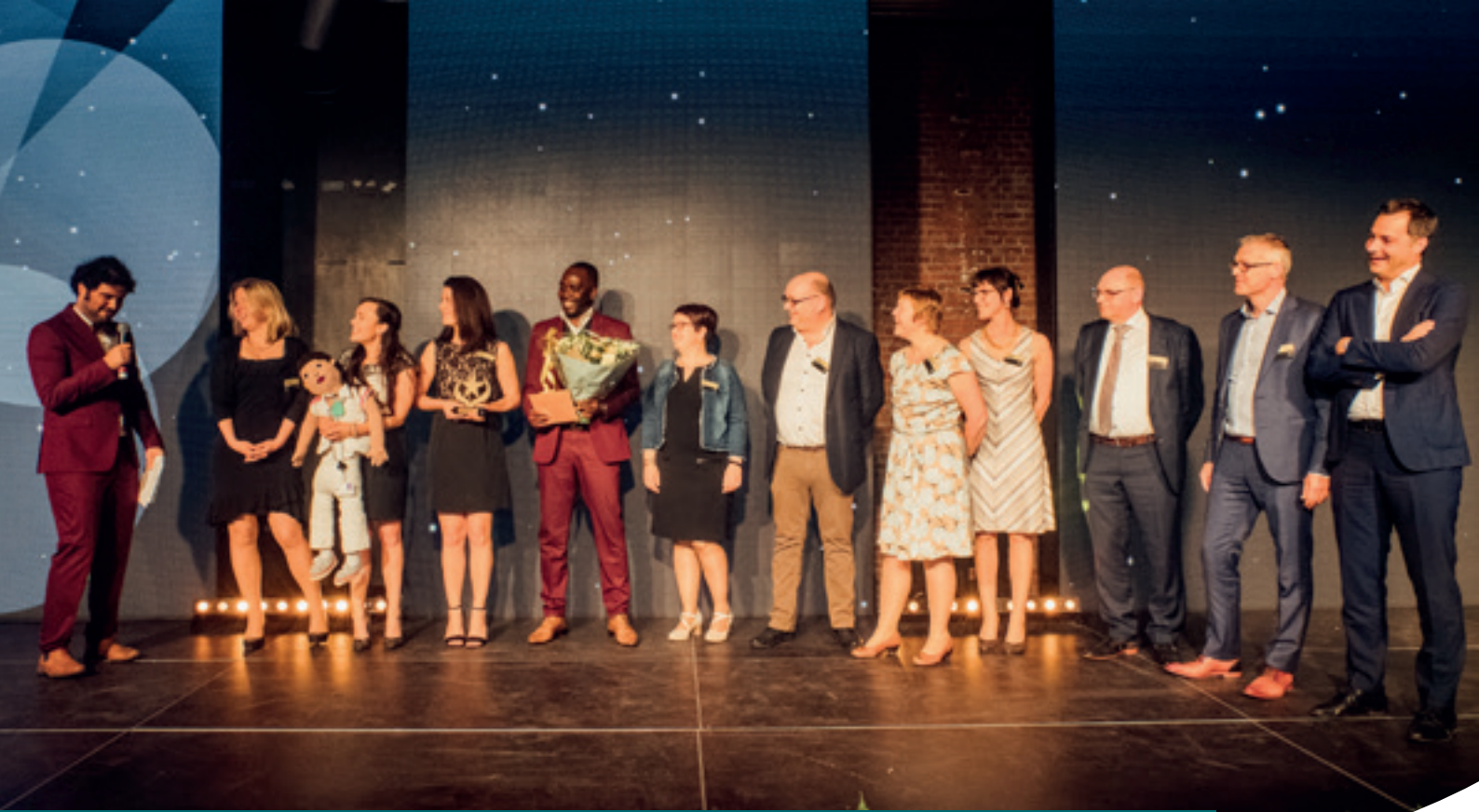
De AZ Alma-delegatie (met pop Brigit) kreeg de award van Zorgwerkgever van het jaar uit handen van vice-premier Alexander De Croo (rechts)

Als genomineerde voor de titel Zorgwerkgever van het jaar was de concurrentie niet mis. De ontlading was dan ook heel groot toen we hoorden dat we de award hadden behaald.