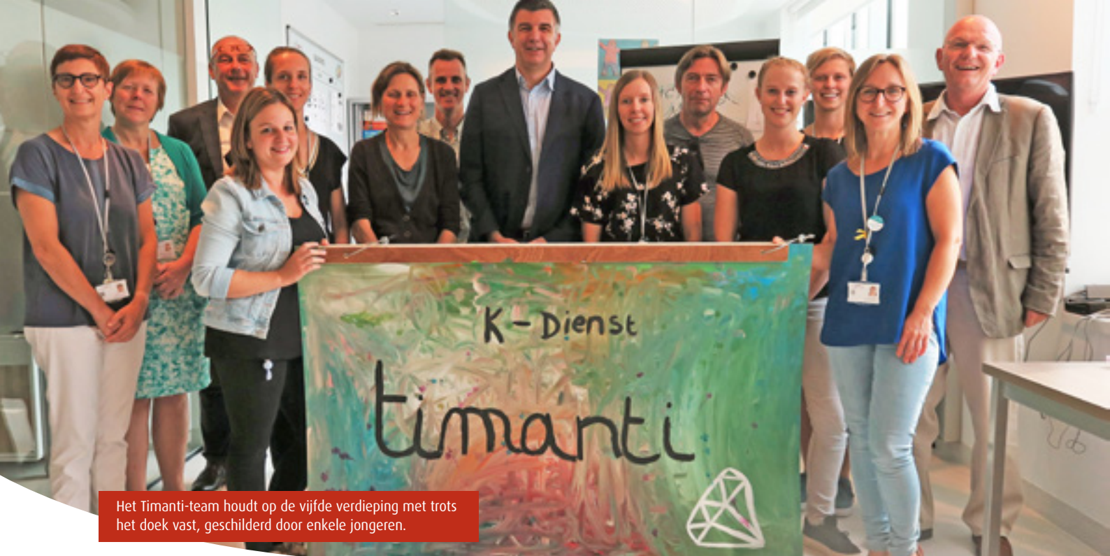
Het Timanti-team houdt op de vijfde verdieping met trots het doek vast, geschilderd door enkele jongeren.