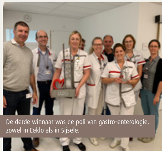
De derde winnaar was de poli van gastro-enterologie, zowel in Eeklo als in Sijsele.