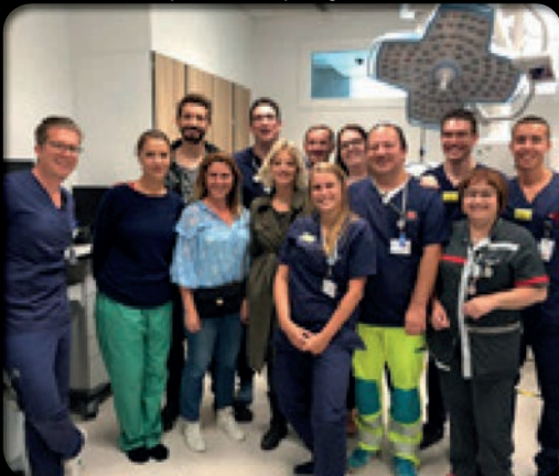
De acteurs gingen graag op de foto met de spoedmedewerkers.