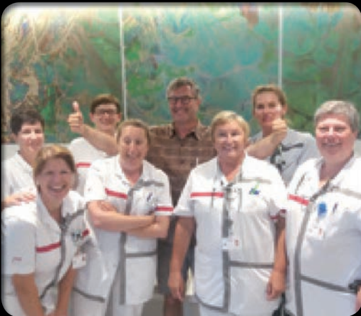
Het team van ZE24 kreeg een paar dagen bekende Vlamingen als gebuur!