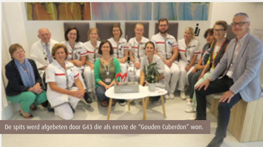
De spits werd afgebeten door G43 die als eerste de “Gouden Cuberdon” won.

Iedere maand verhuist de “Gouden Cuberdon” dus naar een andere dienst of afdeling, maar de winnaars krijgen een mini-replica van het kunstwerk in de plaats zodat zij voor altijd herinnerd blijven als laureaat. ●