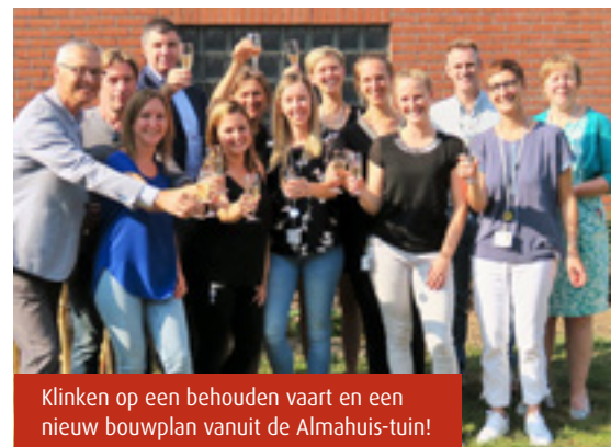
Klinken op een behouden vaart en een nieuw bouwplan vanuit de Almahuistuin!