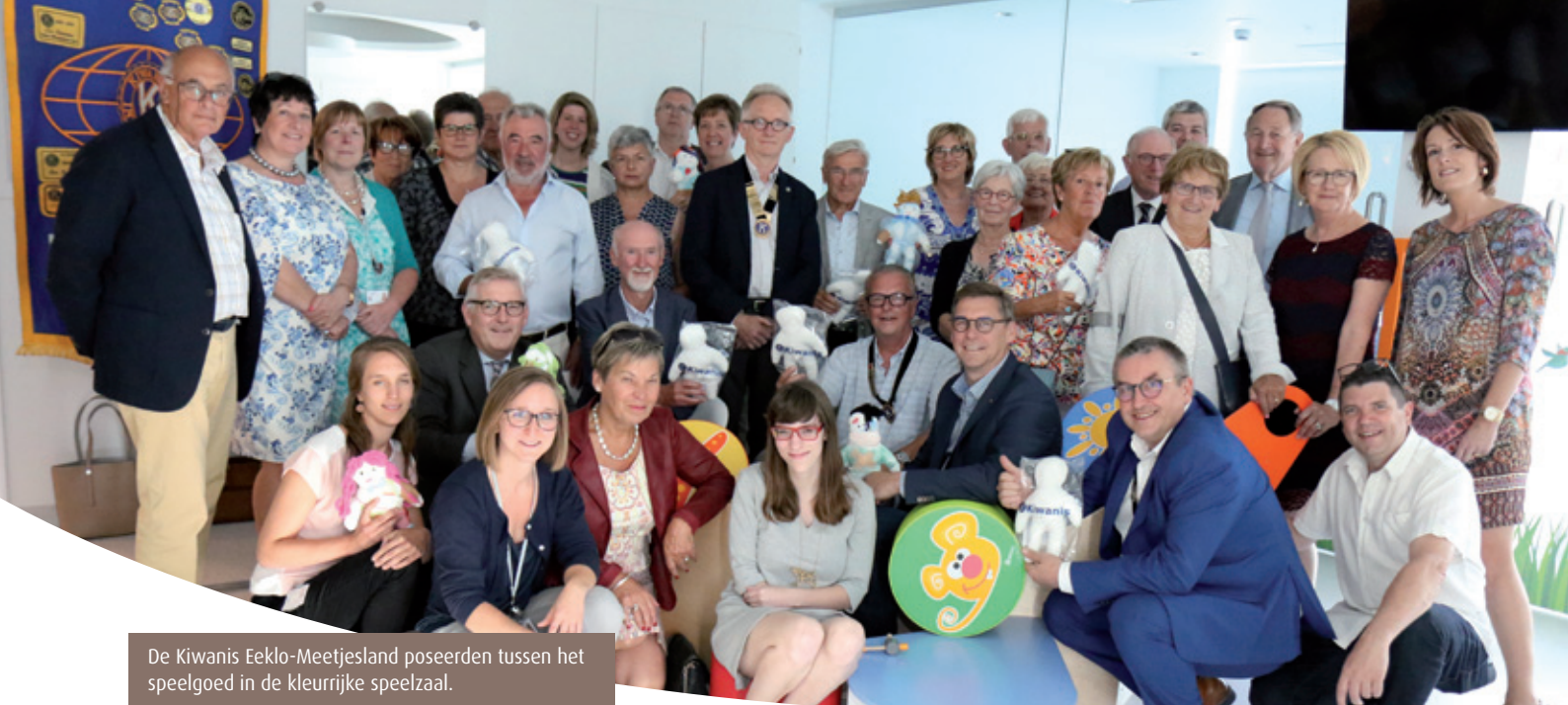
De Kiwanis Eeklo-Meetjesland poseerden tussen het speelgoed in de kleurrijke speelzaal.