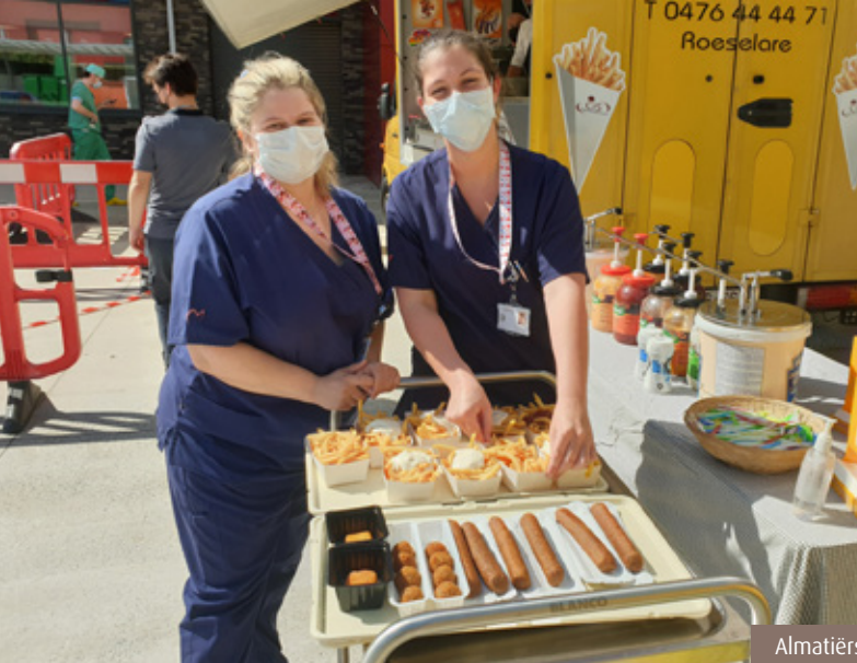
Almatiers zijn echte Belgen