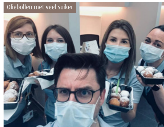
Oliebollen met veel suiker