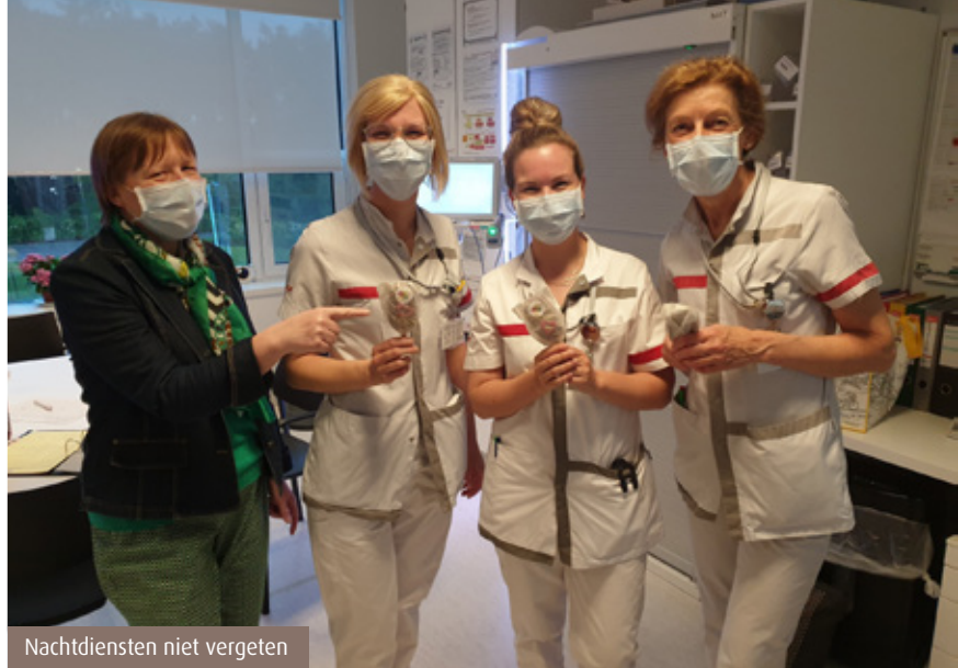
Nachtdiensten niet vergeten