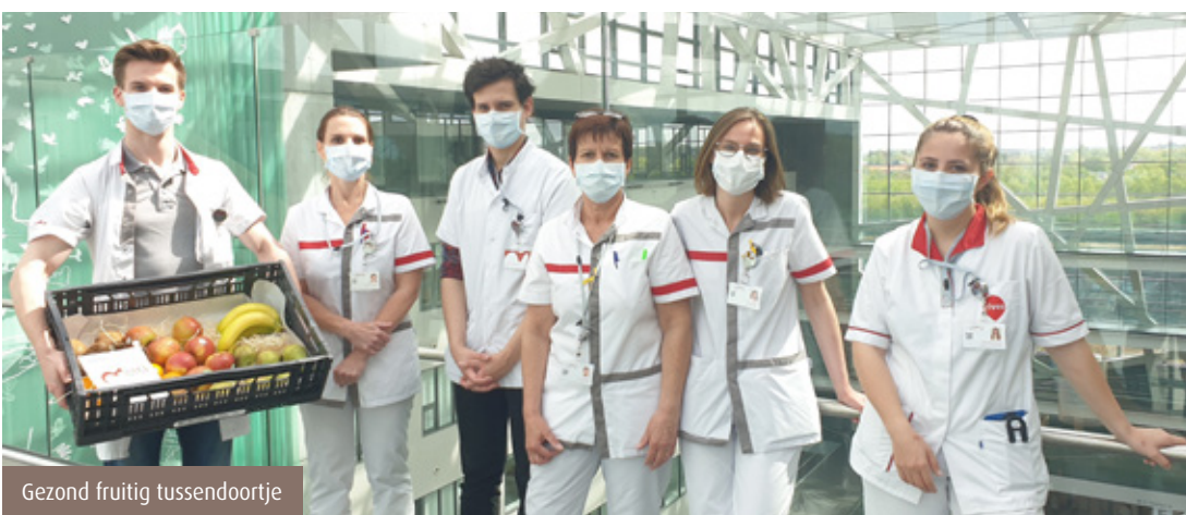
Gezond fruitig tussendoortje

De absolute blikvanger is toch wel de muurtekening van kunstenaar Eva Mouton in de Centrale Schoonmaakber-