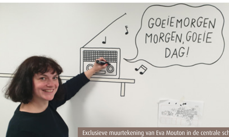
Exclusieve muurtekening van Eva Mouton in de centrale schoonmaakberging