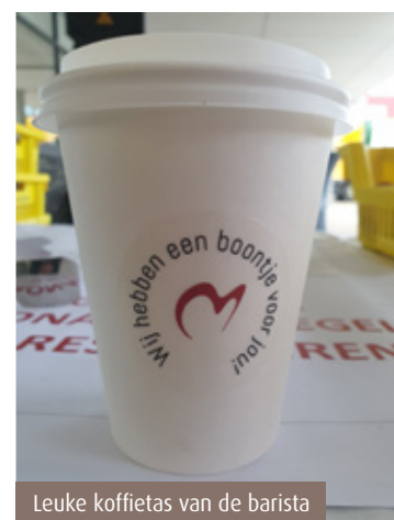
Leuke koffietas van de barista