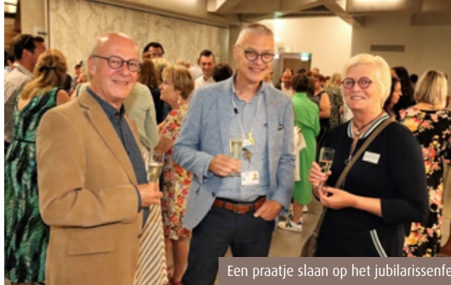
Een praatje slaan op het jubilarissenfeest

"Dat is juist. Kijk maar eens verderop in dit Almagazine: we kenden het voorbije half jaar een groot aantal goede en trouwe medewerkers die op welverdiend pensioen zijn gegaan maar die we moeilijk kunnen vervangen. Om die kwaliteit van zorg te blijven garanderen, zijn dan ook soms onpopulaire maatregelen nodig. Een voorbeeld daarvan is de sluiting van G41, waardoor we de collega's van die afdeling op andere afdelingen kunnen inzetten om personeelstekorten in te dijken. Dit was geen leuke beslissing, maar ik ben blij met de manier waarop de geriateren en het team van het zorgprogramma Geriatrie dit hebben opgevat. Ik onderstreep wel dat dit een tijdelijke maatregel is, die we van zodra het mogelijk is, zullen terugdraaien."