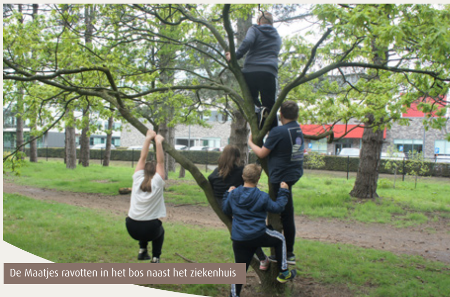
De Maatjes ravotten in het bos naast het ziekenhuis