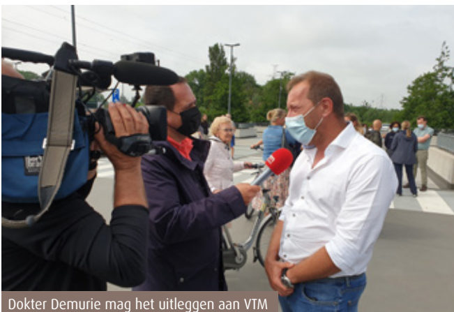
Dokter Demurie mag het uitleggen aan VTM