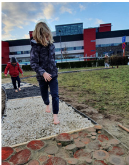
Het blotevoetenpad en andere initiatieven geven de helende tuin mee vorm