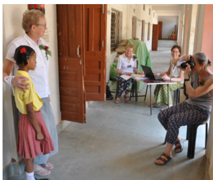
Van elk sponsorkindje werd een actuele foto gemaakt.

“Tijdens ons verblijf controleerden we ook wat er concreet gerealiseerd werd met behulp van de extra giften vanuit ASHA-HOPE zodat we verantwoording kunnen afleggen aan de gemeentebesturen, de organisaties die ons steunen alsook aan de vele individuele sponsors. We namen foto's van zonnepanelen, schoolbanken, sanitair, geleverde lokalen, generatoren, bliksemafleiders, computers en zo veel meer! We bezochten ook alle klassen! In sommige klaslokalen zaten meer dan honderd kinderen samen. Ze begonnen hun schoolopleiding rond hun 3 à 4