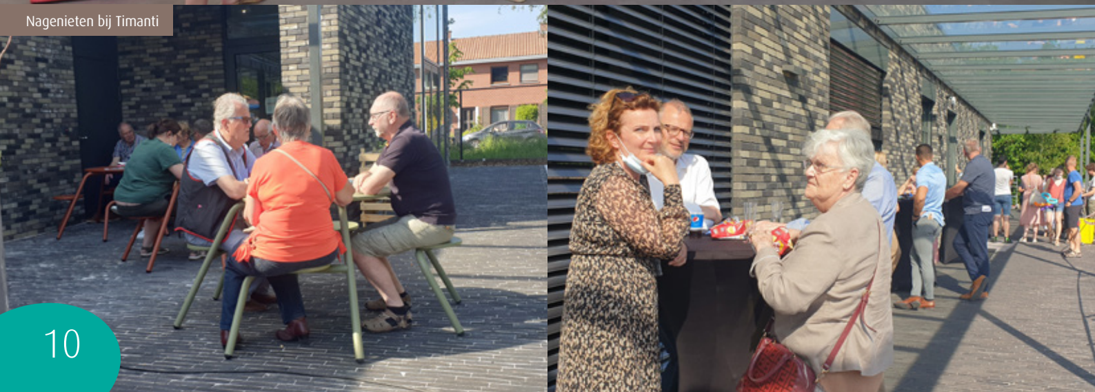
Nagenieten bij Timanti