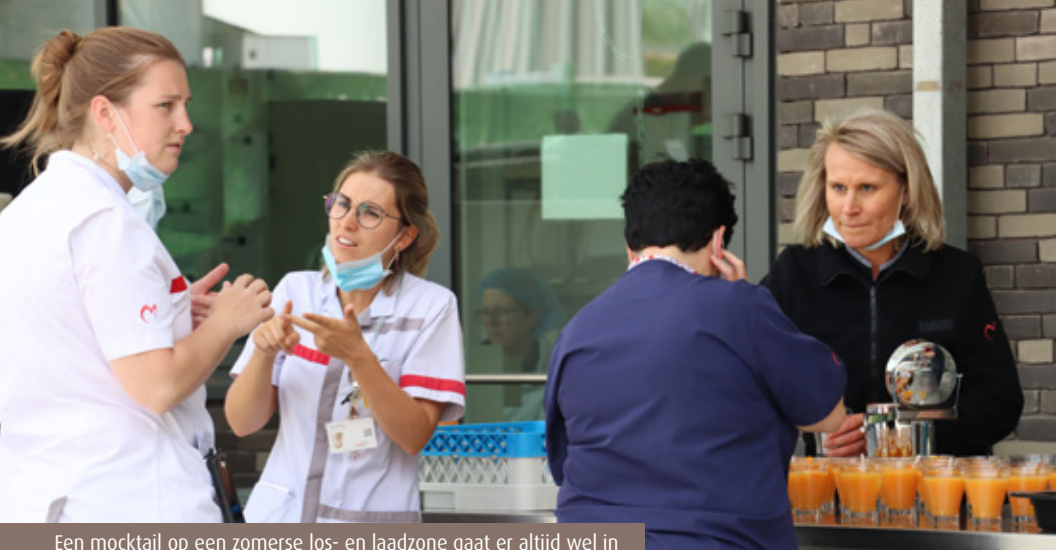
Een mocktail op een zomerse los- en laadzone gaat er altijd wel in