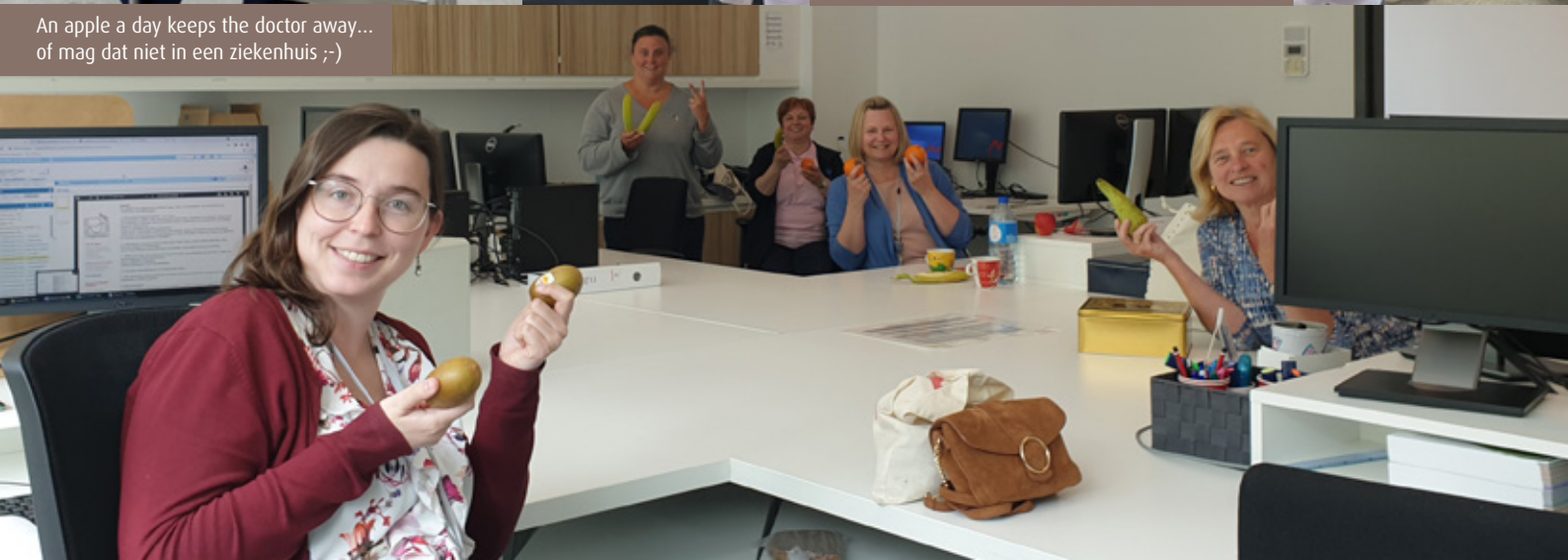
An apple a day keeps the doctor away... of mag dat niet in een ziekenhuis ;-)