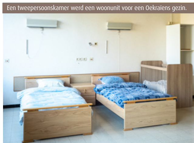
Een tweepersoonskamer werd een woonunit voor een Oekraïens gezin.