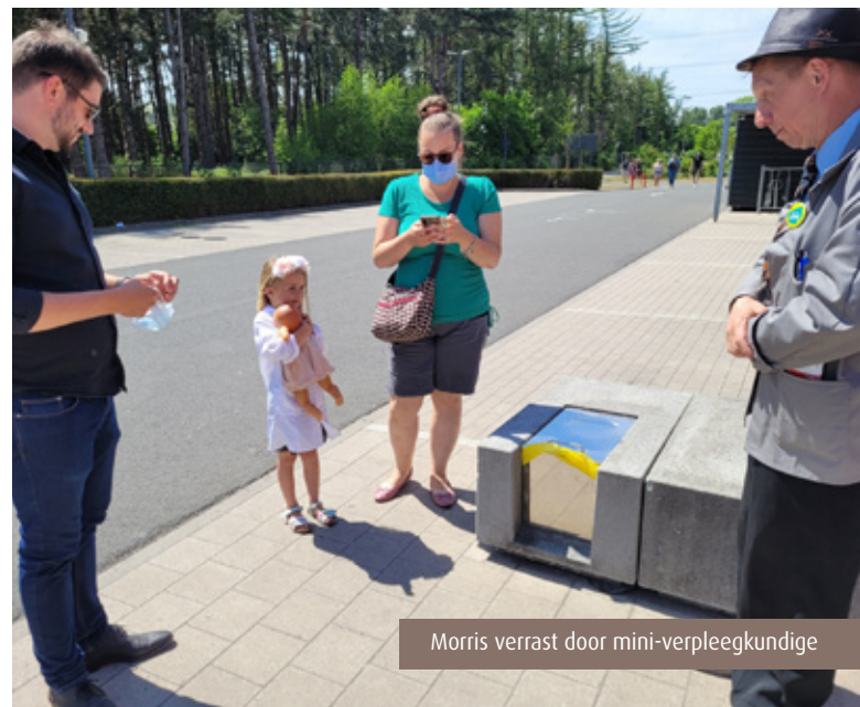
Morris verrast door mini-verpleegkundige

En dan waren er nog de afdelingen zelf die zich van hun meest klantvriendelijke kant toonden: de bezoekers waren verrast door het zeer ruime revalidatie aanbod, door de nieuwe PAAZ -afdeling, door de aanpak van onze afdeling Geriatric maar ook door het uitgebreide jobaanbod van onze HR-dienst . We hoorden ook herhaaldelijk dat het 'hier zo proper is', en hoe dat komt, zagen ze bij het wagenpark van de Schoonmaak. Bij Timanti werd de nieuwste afdeling van AZ Alma getoond en was het tijd voor een verfrissend drankje. ●