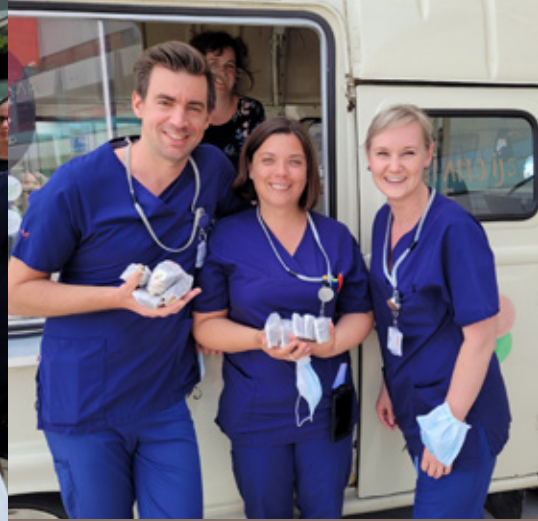
Een Almagnum kan er altijd wel in bij onze Almatiers