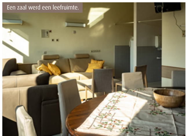
Een zaal werd een leefruimte.