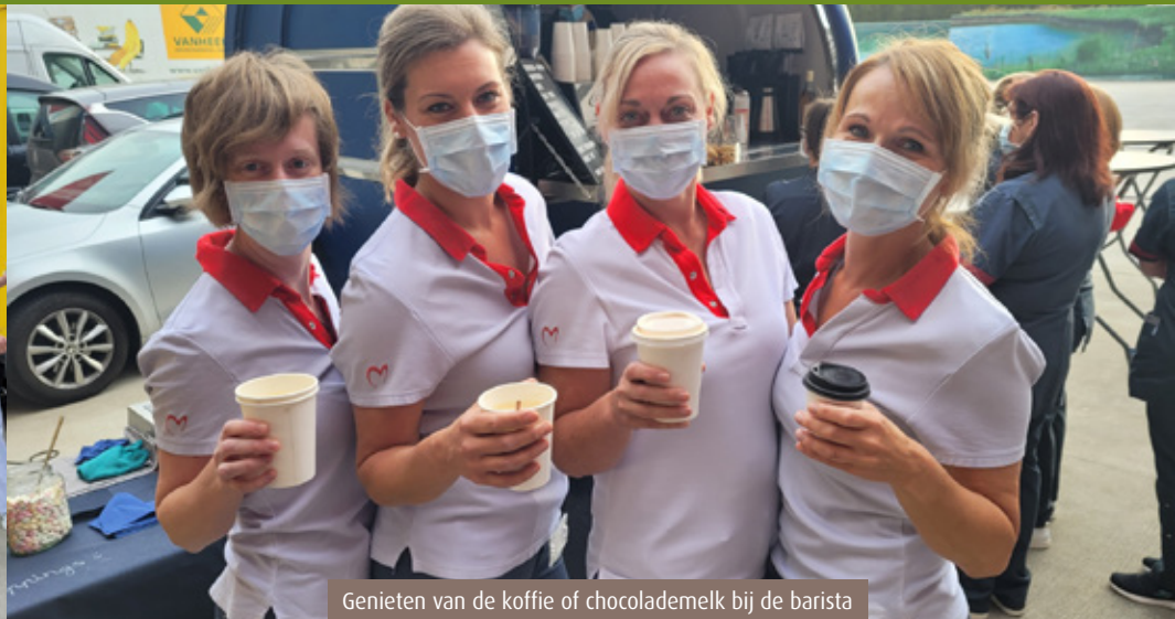
Genieten van de koffie of chocolademelk bij de barista