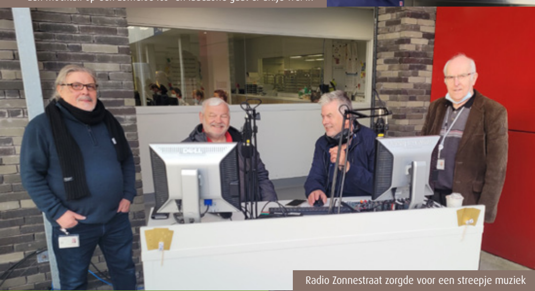
Radio Zonnestraat zorgde voor een streepje muziek

SAVE THE DATE 23 september 2022 Maar u hoeft niet tot volgend jaar te wachten om nog eens uit de bol te gaan, want het Nazomerfeest 2022 komt eraan: afspraak op vrijdag 23 september 2022 op een nog niet te verklappen locatie!