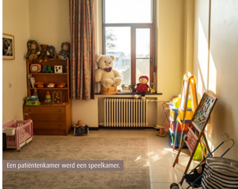
Een patiëntenkamer werd een speelkamer.