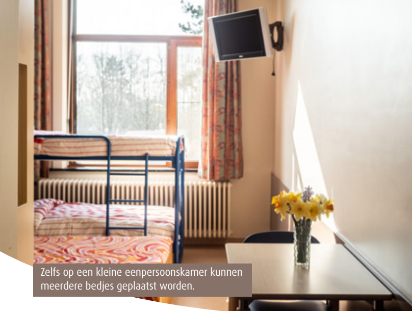
Zelfs op een kleine eenpersoonskamer kunnen meerdere bedjes geplaatst worden.