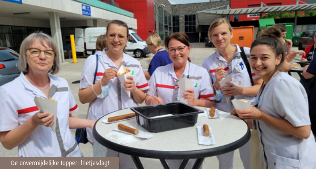
De onvermijdelijke topper: frietjesdag!